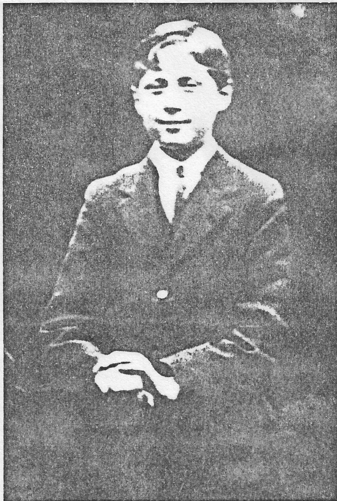
George Orwell a l'edat de catorze anys. Als onze anys, el 1914, publicà en un diari comarcal un poema titulat «Desperteu joves d'Anglaterra!» que constitueix un breu inventari de tots els clíxés de la tradició bèl·lico-poètica britànica.