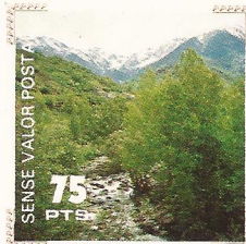
TRADICIONS I COSTUMS DELS PAÏSOS CATALANS