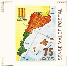
TRADICIONS I COSTUMS DELS PAÏSOS CATALANS

Pel que fa al nostre País, les fogueres tampoc no han canviat gaire. Els Romans i sarrans doxaren fer els seus costums als radis dels indrets on eren ben rebuts, amb les prohibicions de l'Església, però, la festa es va cristianitzar. En èpoques ja més recents, l'ocupació dels Països Catalans per les tropes de Felip V de Castella significa, a més de l'abolició de les nostres Institucions i la prohibició de l'ús públic de la llengua, el marginament de les nostres tradicions, les quals no van tornar a ser autoritzades fins al 1761. Malgrat tot, la festa mai no arribà a desaparèixer.