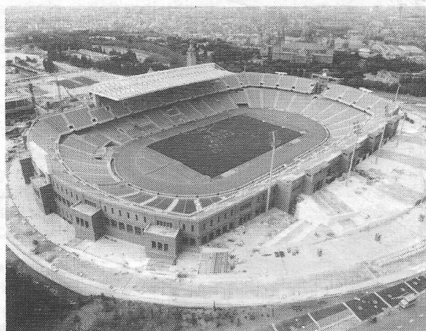
L'antic estadi de Montjuïc, ara reformat de cara als JJ.OO.

Dia 8. Va assistir a l'acte inaugural de l'Estadi Olímpic de Montjuïc, que va ser presidit per Ses Majestats els reis Joan Carles i Sofia, amb motiu de la celebració de la V Copa del Món d'Atletisme.