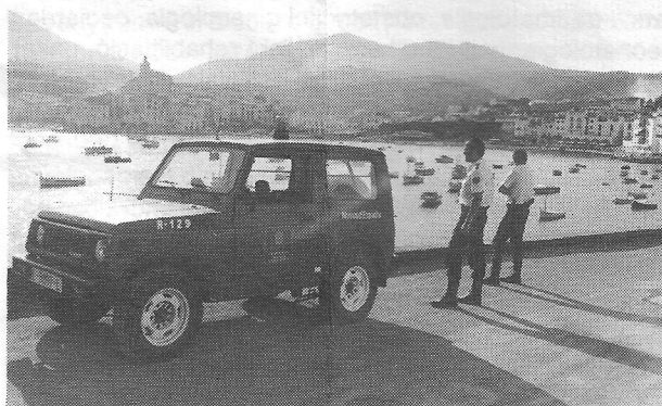
Una unitat dels Mossos d'Esquadra a Cadaqués.