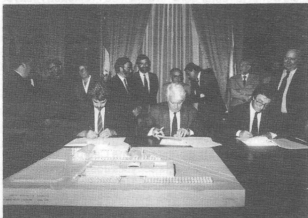
Maragall, Semprún i Guitart en el moment de signar el conveni que farà finalment possible l'auditori de Barcelona.

El dia 19, va tenir lloc a la seu de la Delegació del Govern Central a Catalunya, l'acte de signatura del conveni entre el Ministeri de Cultura, la Generalitat de Catalunya i l'Ajuntament de Barcelona per al finançament de l'Auditori de Barcelona. El conveni va ser signat pel ministre de Cultura, senyor Jorge Semprún; el conseller de Cultura, senyor Joan Guitart, i l'alcalde de Barcelona, senyor Pasqual Maragall.