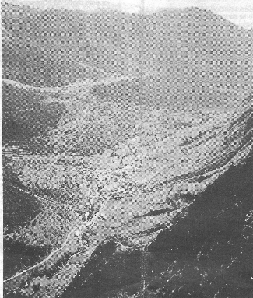
Espot i la seva vall, al Pallars Sobirà.