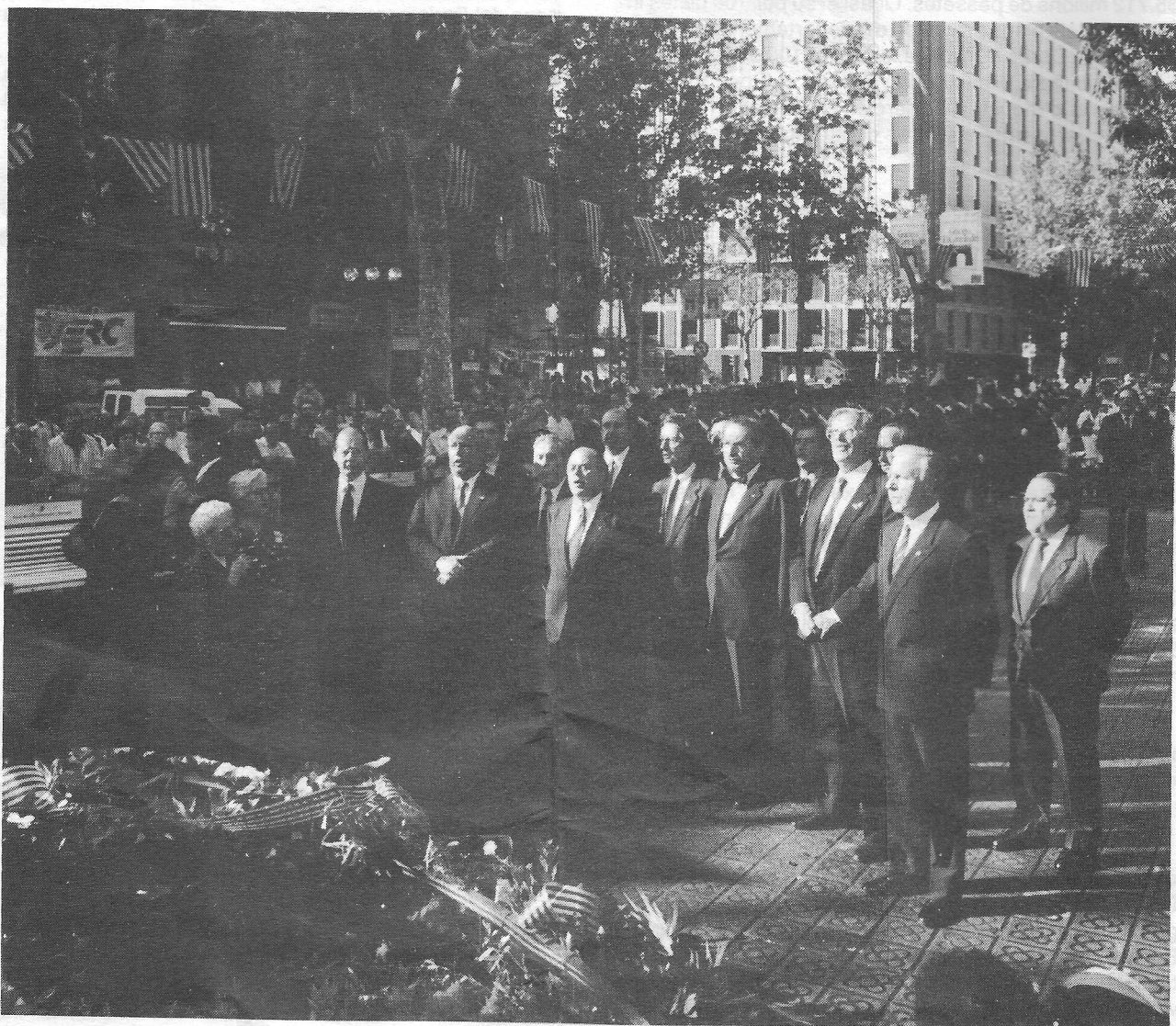
Ofrena floral del govern de Catalunya a Rafael Casanova, conseller en cap de Barcelona el 1714.

- I una última consideració. Com deia, aquest moment que estem vivint el podem aprofitar bé si Catalunya té força. Quina força? La de la seva economia, la del seu moviment polític, la de la seva cultura. Però també, i sobretot, la força del nostre sentit d'identitat, de la nostra energia en la defensa de les nostres coses, de la nostra cohesió, de les nostres ganes de fer un país del que ens puguem sentir contents. Ha de ser una força serena, que no vol dir claudicant. Una força d'afirmació, que no vol dir de rebuig o d'agressió. Una força pacífica, que no vol dir tímida. Una força moral feta de convicció, d'exigència amb nosaltres mateixos, d'esperit constructiu i de confiança en el nostre país.